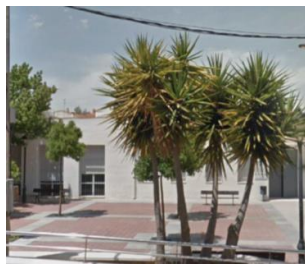
CCM EL VALLE