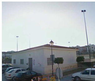
CCM LLANO DE LAS TINAJERÍAS