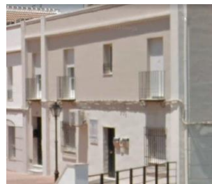
CCM FRASQUITO ESPADAS